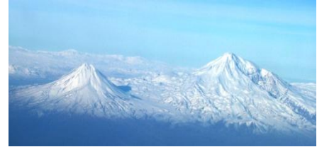
Cartografía de Armenia

En 380, el Edicto de Tesalónica, declarado por el emperador Teodosio I, estableció el cristianismo como la religión oficial del estado del mundo romano. Prohibió efectivamente el politeísmo romano. Como resultado, avanzó al nivel alcanzado por Armenia décadas antes. Teodosio I fue el último emperador en gobernar los sectores occidental y oriental del Imperio. Un aspecto más progresista de una civilización estaba en movimiento con confianza, se iba a convertir en global. Además, la Cruz también se convertiría en un emblema intercultural.