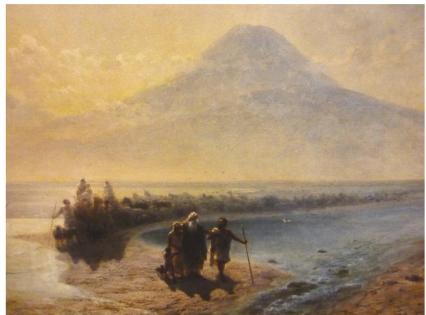
El arca viene a paz. Noah desciende de la Montaña Sagrada y planta un viñedo en el valle de Ararat. La ilustración es un detalle de la pintura de Aivazovsky del siglo XIX, Noah Descendiendo Monte Ararat.

En 301, Armenia, un reino independiente, reconoció el cristianismo como la religión oficial del estado. El monarca del país, Tiridates III había sido convertido al cristianismo por San Gregorio el Iluminador. Los relacionados acontecimientos desgarradores que condujeron a esa fecha histórica fueron considerables. Sin embargo, todas las formas de paganismo fueron eliminadas de manera rápida y decisiva, un logro significativo, estableciendo así un conjunto amplio y progresivo de valores y tradiciones. Desafortunadamente, su vecino occidental, el Imperio Romano, sufrió importantes persecuciones cristianas incluso después de que Armenia reconoció la nueva fe. De hecho, las persecuciones iniciadas durante el gobierno reformista del emperador Diocleciano fueron las peores en la historia romana: los santos fueron martirizados.