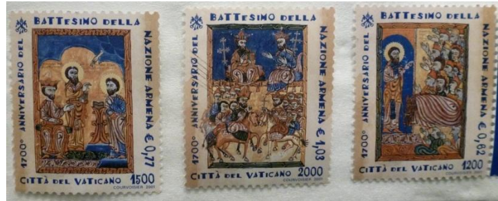
En 2001, numerosos líderes eclesiásticos se reunieron en Armenia para conmemorar la adopción del cristianismo por parte de los armenios en 301. Varios países emitieron sellos para la ocasión. El conjunto ilustrado es del Vaticano, para el 1700 aniversario, destacando los famosos manuscritos iluminados armenios de la temprana edad media.

En 2001, el Papa Juan Pablo descendió al pozo de San Gregorio. En 2015, debido a los eventos conmemorativos del centenario del Genocidio, el Vaticano celebró una misa papal televisada a nivel mundial en la Basílica de San Pablo. Un año después, el Papa Francisco siguió esa ilustración visitando Armenia y celebrando una misa junto con el Católico Nacional de Armenia en el lugar venerado. Como se ilustra, el sitio de peregrinación, con su primera iglesia construida en 642, ahora se incluye dentro del complejo del monasterio Khor Virap de la Iglesia de Armenia, que el Monte Ararat pasa por alto majestuosamente, como decrece la Providencia. construida en 642, ahora se incluye dentro del complejo del monasterio Khor Virap de la Iglesia de Armenia, que el Monte Ararat pasa por alto majestuosamente, como decrece la Providencia.