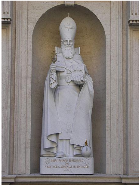
En el Vaticano, la prominente estatua de mármol de San Gregorio el Iluminador está situada a lo largo de la fachada norte de la Basílica de San Pedro, la Basílica de Sanet Petri, en una notable proximidad a la entrada principal.

proselitismo prominente de la nueva fe. Sin embargo, después de 12 años y algunas tribulaciones, Tiridates rescindió su orden y permitió que San Gregorio el Iluminador saliera del pozo. Es el primer paso global del cristianismo hacia una amplia gama de estructuras estatales múltiples y progresivas.