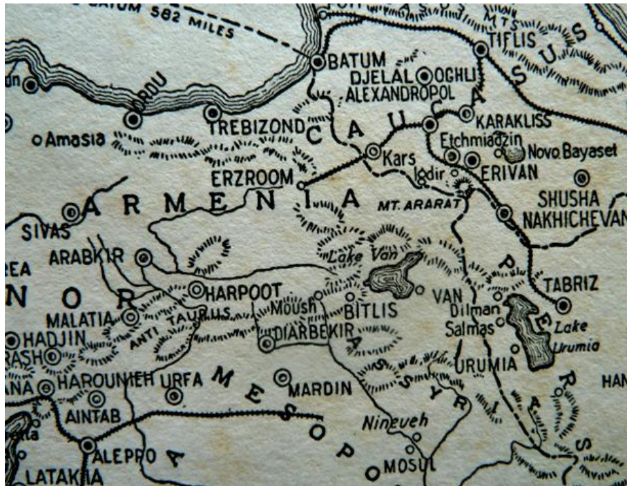
Основные регионы, где уничтожались армяне, отмечены американским изданием от 1923 г.

Зенковский, Серж А. «Пантюркизм и ислам в России», Кембридж и Массачусетс, Гарвард Университи Пресс, 1967.